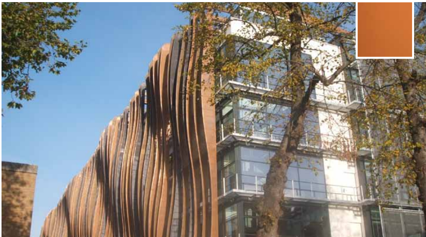
Vertical solar shading fins, each clad in either Nordic Bronze, Nordic Brass or Nordic Brown™. Holland Park School, London; Architects: Aedas.